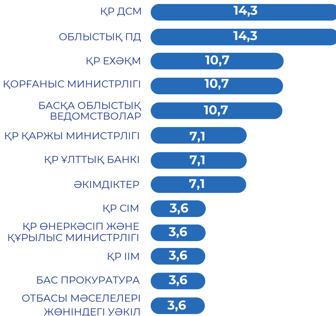
4-сурет - Теріске шығарулар саны бойынша ведомстволардың рейтингі, 2026 жылғы II тоқсан, %

2026 жылдың II тоқсанында ресми теріске шығарулардың ең көп санын ҚР ДСМ мен облыстық ПД жариялады. Олардың әрқайсысына жалпы көрсеткіштің 14,3%-ы тиесілі. Келесі кезекте ҚР ЕХӘҚМ, ҚР Қорғаныс министрлігі және басқа деңгейдегі облыстық ведомстволар орналасқан – әрқайсысы 10,7%-дан. Теріске шығарулардың 7,1%-ы ҚР Қаржы министрлігіне, ҚР Ұлттық Банкіне және әкімдіктерге тиесілі болды. Жалпы алғанда, құрылымдық талдау II тоқсанда фейктерге ден қою бойынша жүктеме әлеуметтік, құқық қорғау және өңірлік бейіндегі ведомстволарға түскенін көрсетеді.