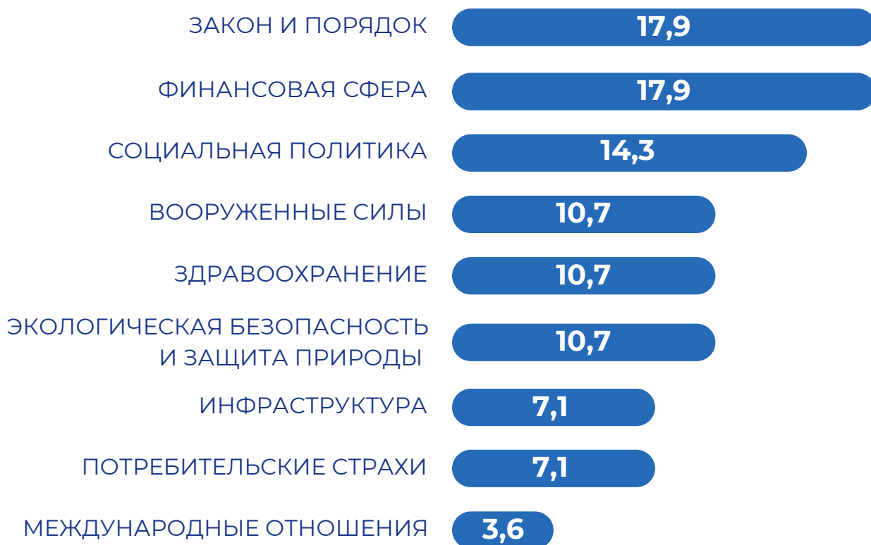
Рисунок 1 - Распределение случаев дезинформации по тематическим направлениям, II квартал 2026 г., %

10,7% также достигли темы здравоохранения (вирусы, подорожание лекарств, мифы о вакцинации) и экологической безопасности (стихийные бедствия, животный мир).