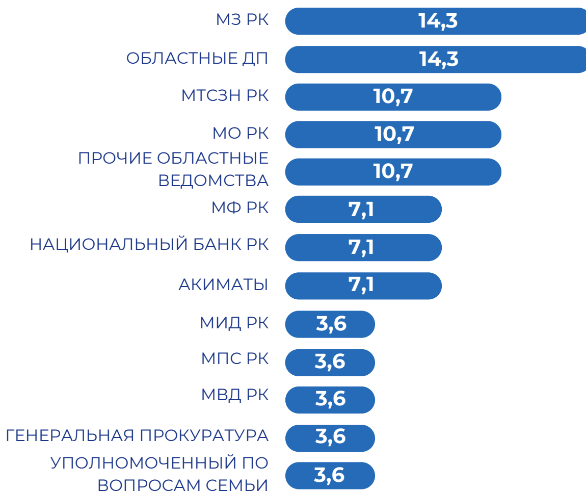
Рисунок 4 - Рейтинг ведомств по количеству выпущенных опровержений, II квартал, 2026 г., %

Во II квартале 2026 года наибольшее количество официальных опровержений выпустили МЗ РК и областные департаменты полиции - по 14,3% от общего числа. Далее следуют МТСЗН РК, МО РК и прочие областные ведомства - по 10,7%. По 7,1% опровержений пришлось на МФ РК, Национальный банк РК и акиматы. В целом структура показывает, что основная нагрузка по реагированию на фейки во II квартале пришлась на ведомства социального, правоохранительного и регионального профиля.