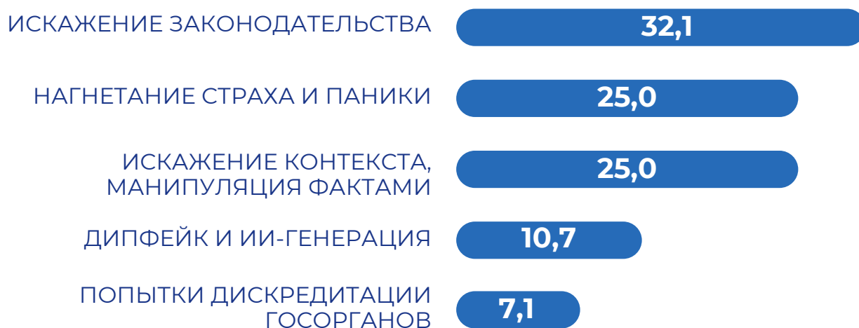
Рисунок 3 - Распределение методов дезинформации, II квартал 2026 г., %

Смена приоритетов заметна и по распределению целей: на дискредитацию госорганов пришлось всего 7,1% случаев. Прямое давление на репутацию ведомств уступило место абстрактным инфоповодам: авторы фейков предпочитали атаковать не сами структуры, а решения и законы, которые они принимают.